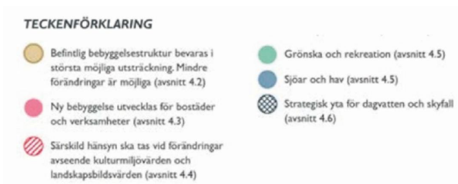
Figur 1. Vägledning för bevarande och utveckling av Björknäs och Eknäs, (Nacka kommun, 2024).

Planenheten startade med en utredning med förslag till vilka områden som ska detaljplanläggas med ovan beskrivna syfte, med tidplan och kostnadsuppskattning (kommunstyrelsen den 5 maj 2025, §118). I uppdraget ingick att prioritera de områden som idag är planlösa för att minimera riskerna för en oönskad utveckling av området.