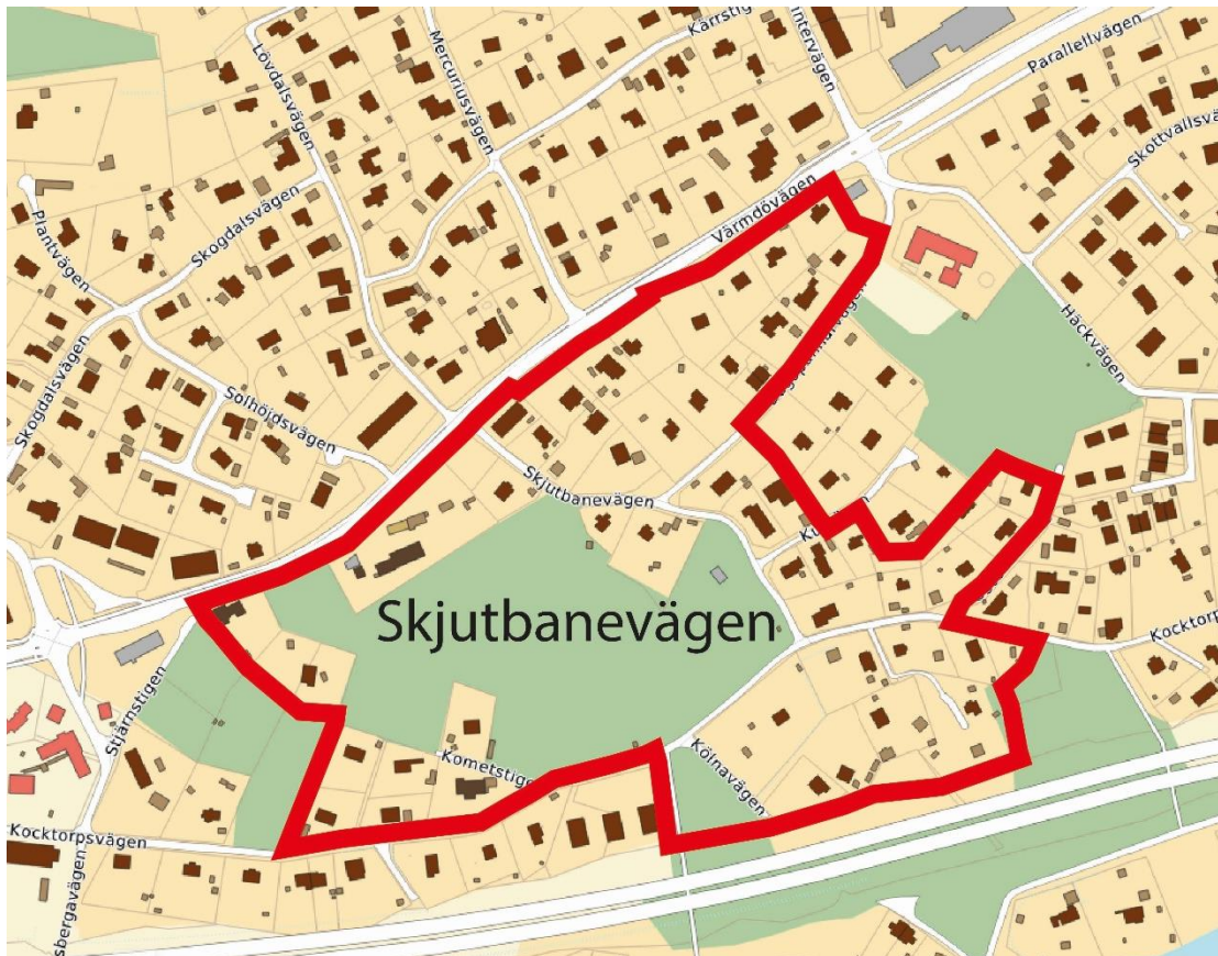
Figur 4. Preliminär utbredning av detaljplanen, (Nacka kommun, 2026).